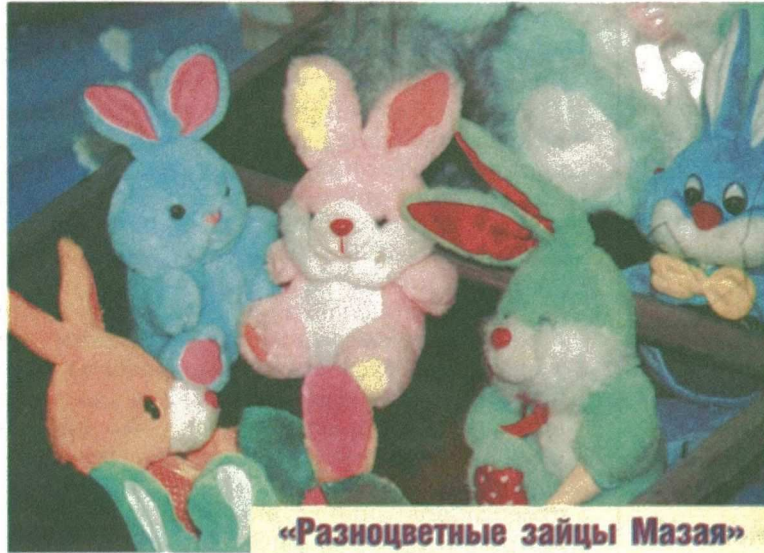
«Разноцветные зайцы Мазая»

Впервые в Сургутском краеведческом музее открылась весьма необычная выставка «Там, на неведомых дорожках». Ее главное отличие заключается в том, что данная экспозиция рассчитана исключительно на маленьких посетителей. По словам заведующей научно-образовательным отделом краеведческого музея Людмилы Фроловой, экскурсия проходит таким образом, что сложно предугадать, в какую сказочную страну попадут ребяташки в следующую минуту - сюжет экскурсии меняется на ходу.