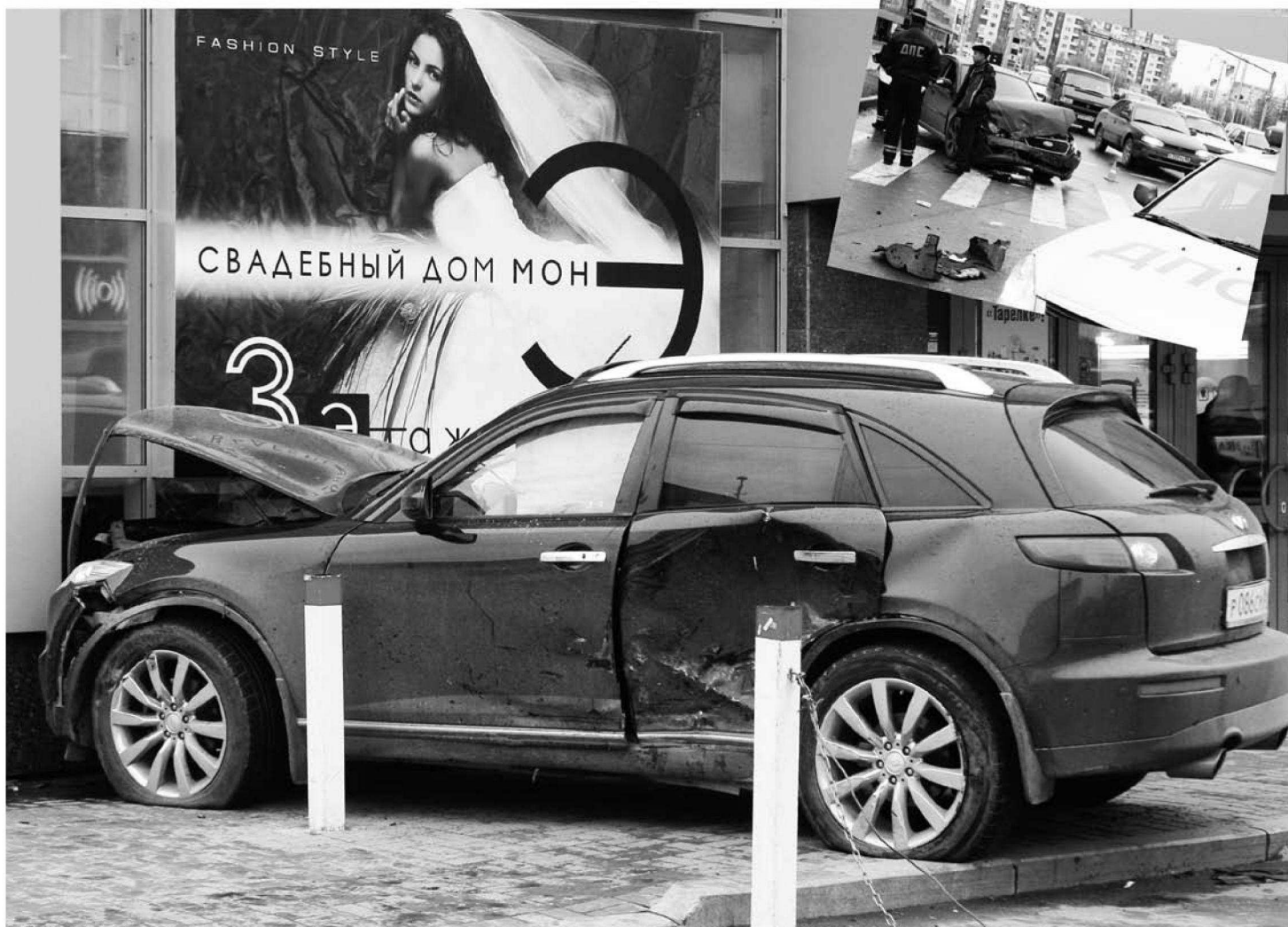
Коллаж: Леонид Березницкого