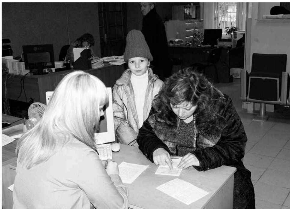
Получение вида на жительство в Ханты-Мансийске (эта семья второй раз приезжает в окружное УФМС)

Возьмем в качестве примера постановку иностранных граждан на миграционный учет, в ходе которой принимающая сторона предоставляет нам копию документа. Считайте, то же самое, что по электронной почте прислать. А потом выясняется, что та или иная миграционная карта поддельная и мы по ней поставили гражданина на миграционный учет. Но ведь мы не можем определить по копии, под-