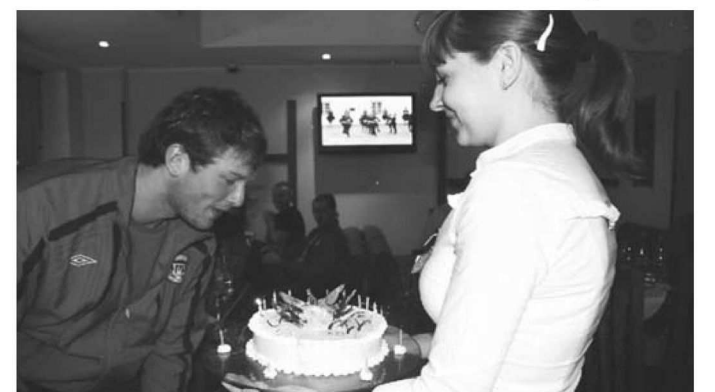
25 свечей – одним выдохом