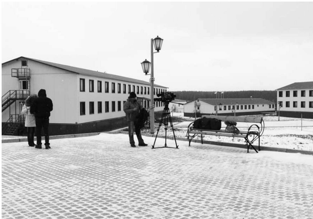
Вахтовый городок Талакан

— Здесь, кстати, и в нефти тоже содержится достаточно высокая концентрация соли, — просветил нас главный инженер НГДУ «Талаканнефть» Виталий Быков . — Это тоже особенность месторождения, кроме того, здесь нефтяные пласты залегают гораздо выше, то есть ближе к поверхности, чем у нас в Западной Сибири. С одной стороны, это плюс, но здесь мы