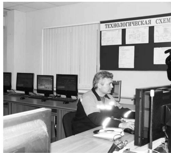
Операторная ГТЭС Талакан

вость в том, что вода в ней соленая, и она, кстати, не единственная соленая река в Якутии. Так, в речке Солянке, впадающей в Лену неподалеку от г. Олекминска, на каждый литр воды приходится 21 грамм соли. В этой же местности протекают большие ручьи, в которых насыщенность соли достигает 70 граммов на литр воды. Обь-