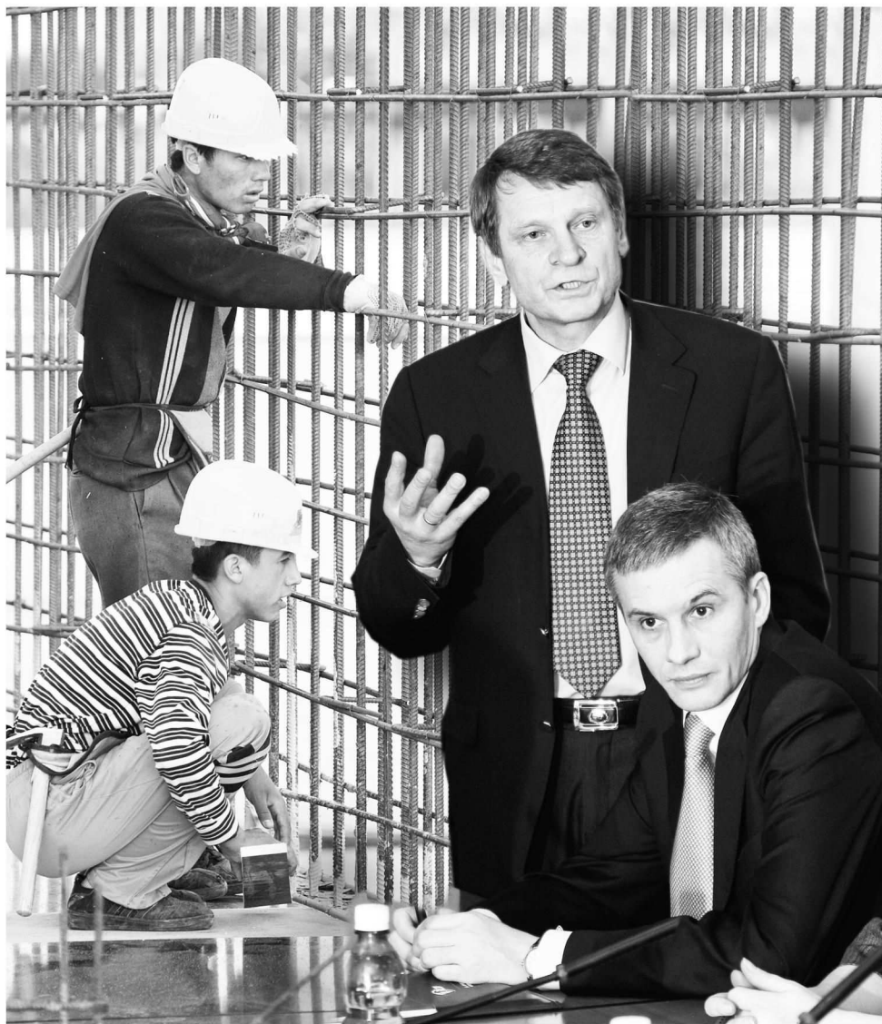
Коллаж Леонида Березницкого

законность Прокуратура быстрого реагирования