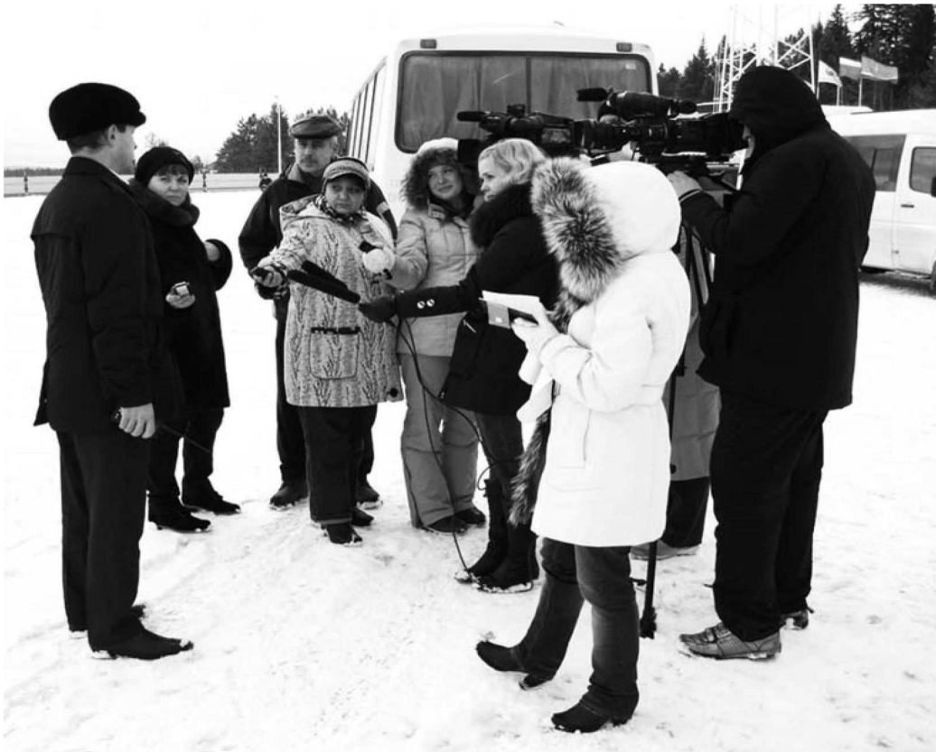
Журналисты на Талакане

столкнулись с рядом сложностей, и, чтобы преодолеть их, нередко приходилось искать новые пути решения, применять технологии, которые до этого не использовались в мировой практике добычи нефти.