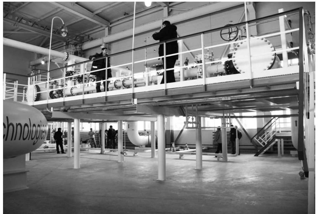
Коммерческий узел учета

В малообжитом, диком краю мы увидели, насколько хорошо поставлена культура производства, налажен быт, развита вся социальная инфраструктура - объекты связывают дороги с твердым покрытием, обустроены жилые городки, работает устойчивая мобильная