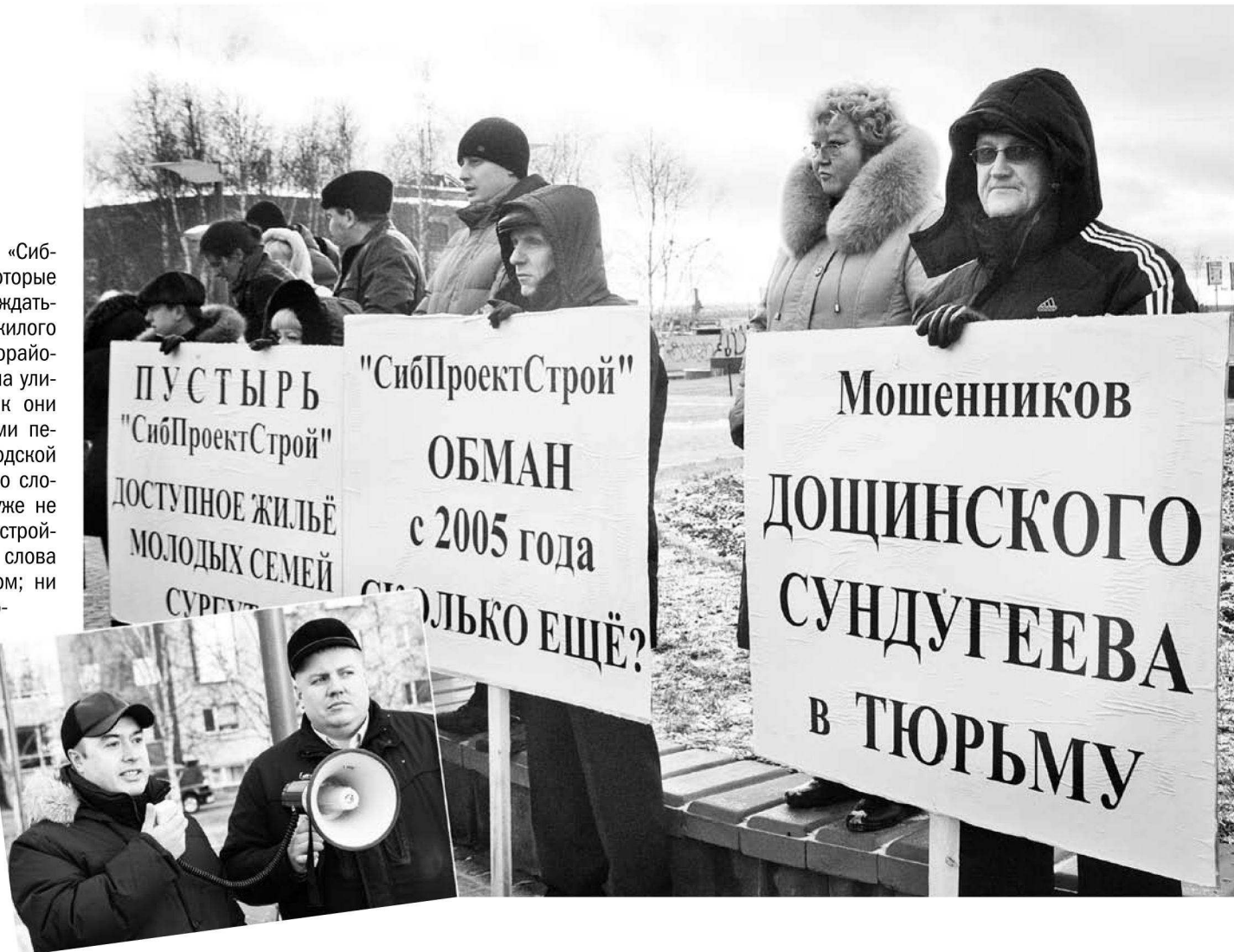
Коллаж Леониды Березницкого

акция Первокурсников научат строить карьеру