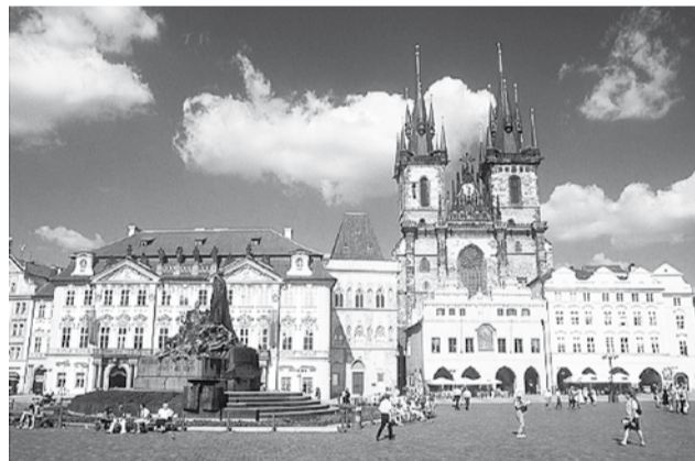
Пражский Карлов университет