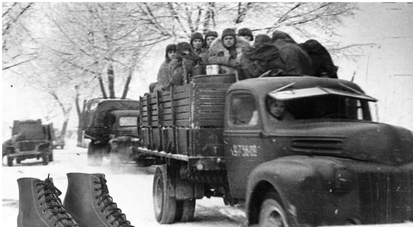
Американские грузовики «студебеккеры» и кожаные ботинки поставлялись в нашу страну по ленд-лизу.

Существовало три основных маршрута доставки лендлизовских грузов в СССР: северный, тихоокеанский и трансиранский. Самым коротким (2 000 миль) и удобным был северный маршрут: через Великобританию и Исландию в порты Архангельска и Мурманска. Суда проходили это расстояние за 10-12 суток. Удобство незамерзающего и связанного с железной дорогой Мурманска было бесспорным. Можно было расширить портовое оборудование и увеличить пропускные способности порта в короткие сроки, но в начале войны этому воспрепятствовало наступление противника. Вражеская авиация базировалась в 10 минутах лета от порта, а система ПВО Мурманска в начале войны оставляла желать лучшего. Немецкие окопы пролегли в 40 километрах, а в районе станции Свирь враг перерезал единственную железную дорогу, связывающую Мурманск со страной. Более безопасными в это время были порты Белого моря – Архангельск и Молотовск (Северодвинск). Как и Мурманск, они имели выход к железной дороге, но в отличие от него зи-