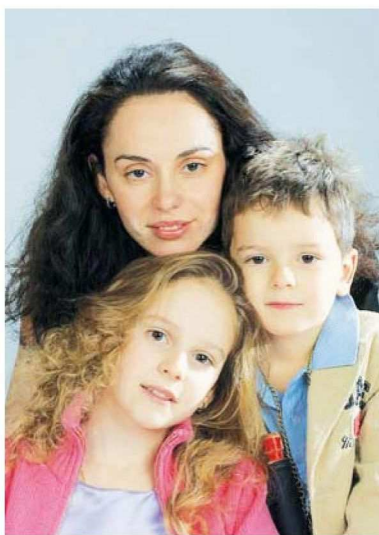
Любимая жена и дети

Вы спрашивали, какие качества я ценю? Вот она как раз