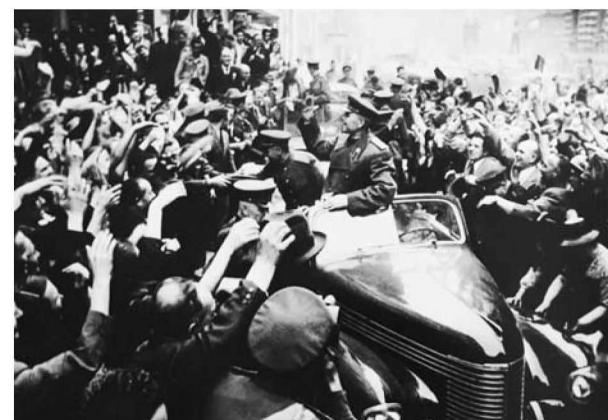
Жители Праги приветствуют маршала Конева. Май 1945 г.

У Конева было две отличительных черты: смелость и трезвость. Что касается первой, не то чтобы он под пулями не пригибаясь бегал, так делали все командиры, - Иван Степанович не боялся перечить Сталину. Почти сутки он и Жуков доказывали верховному, что в 1942 году рановато перекидывать войска из Москвы под Сталинград. И пришли таки к компромиссу. А в 1946-м, когда Сталин решил репрессировать зарвавшегося Жукова, Конев встал на его защиту и отстоял старого друга-сослуживца. Жукова отправили в Одессу, где тот проявил себя изрядным омонцем (смотрим фильмы «Три дня в Одессе» и «Ликвидация»).