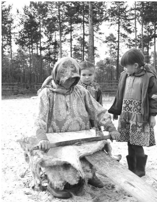
Не будет леса - не будет зверя, не будет зверя - не будет шкур

сегодня подобных ситуаций - единицы. Большинство аборигенов самостоятельно договариваются с недропользователями и получают от них компенсации в виде денежных средств, топлива, снегоходов, электростанций, моторных лодок, спонсорской помощи на проведение праздников. Общественное внимание сегодня пытаются привлечь лишь ханты, которые уже не хотят вести традиционный об-