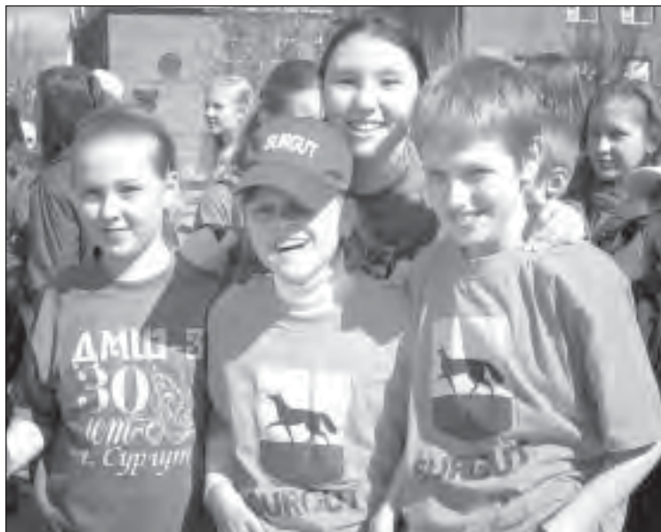
В летние лагеря рвутся пока не особо рьяно.

Всего на летний отдых детей в Сургуте планируется израсходовать порядка 105 млн. рублей, не считая тех средств, которые выделяют на эти цели градообразующие предприятия. Самую большую часть расходов (30,8 млн. руб.) понесет бюджет города, чуть меньше - Фонд социального страхования (29,1 млн.), родительская плата должна составить 20,2 млн. рублей.