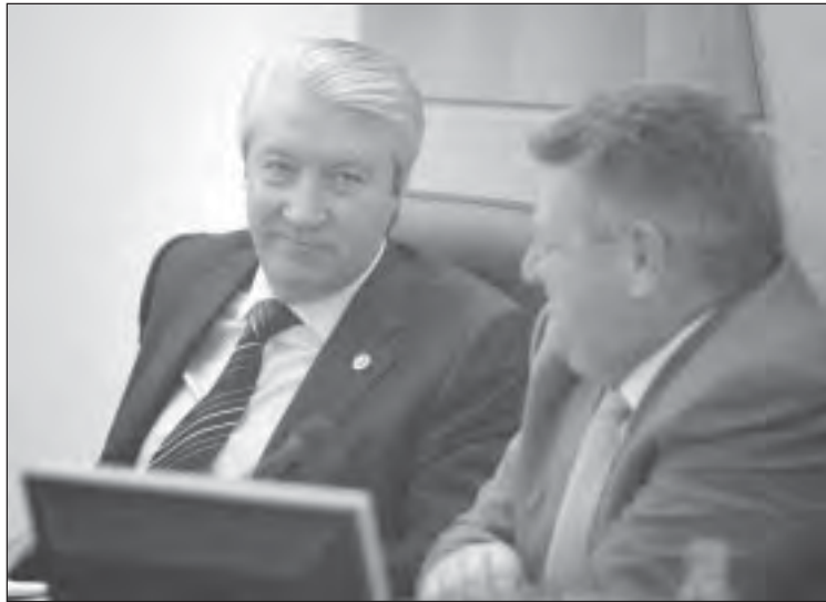
Плюс пять месяцев к сроку – это много или мало?