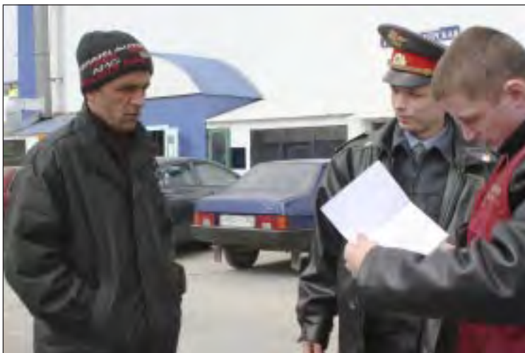
Русский язык при проверках нелегалы моментально забывают.

Бывшие республики СССР поставляют России не лучших своих представителей