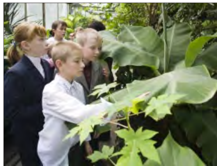
Экологические проекты очень популярны среди школьников и дошколят.

Череда мероприятий в рамках экологической акции пройдет на станции юных натуралистов. В июне здесь организуют летние трудовые бригады с привлечением старшекласников для работы в школьном лесничестве. В августе юные сургутские натуралисты отправятся в экологическую экспедицию в государственный природный парк «Кондинские озера», где займутся научно-исследователь-