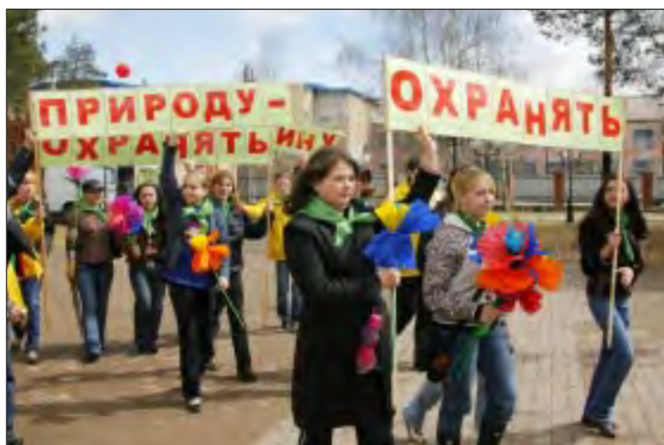
Экологи выйдут на марш «Зеленое шествие».