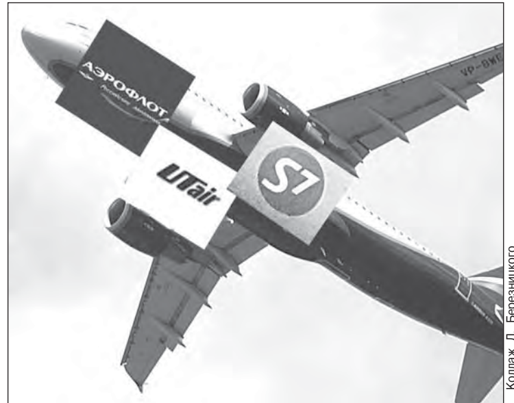
Коллаж Л. Березницкого

рынке появился второй по размеру российский авиаперевозчик. Сегодня ОАО «Авиакомпания «Сибирь» (S7 Airlines) является крупнейшей авиакомпанией на внутренних воздушных линиях России и входит в этом сегменте в TOP-50 мировых авиаперевозчиков. А это значит, что в регион пришел реальный конкурент, способный потеснить монополиста, занять свою нишу в рыночном секторе, что нами, потребителями, только приветствуется.