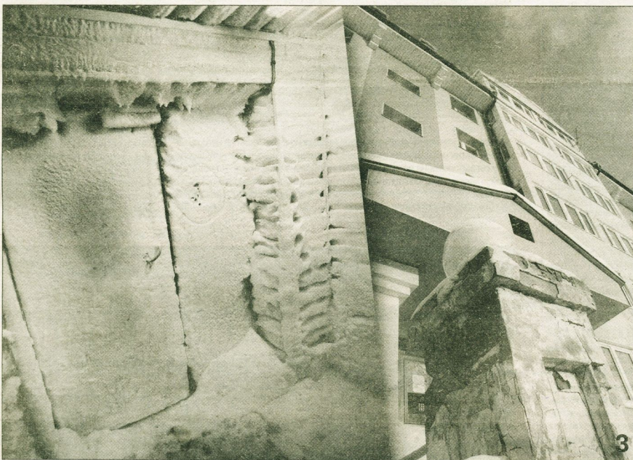
Коллаж Лилинда Борозниченко

Дом, встречавший Косыгина и Горбачева, приходит в упадок