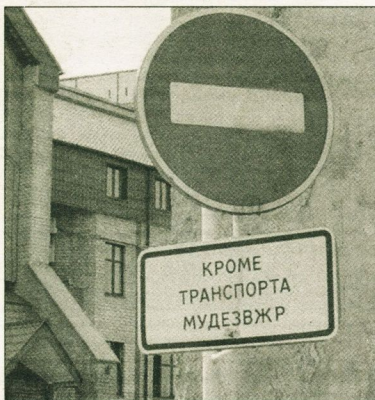
МУДЕЗ - он и в ВЖР МУДЕЗ.