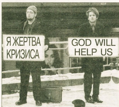
God will help us - Бог спасет нас.