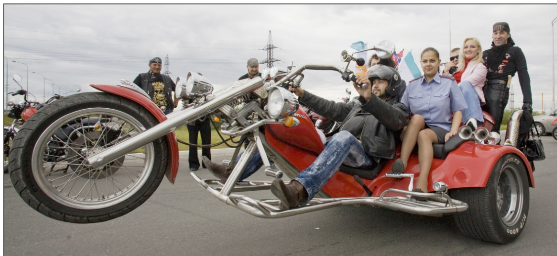
Сотрудницы ГИБДД тоже не прочь прокатиться на чудо-технике.