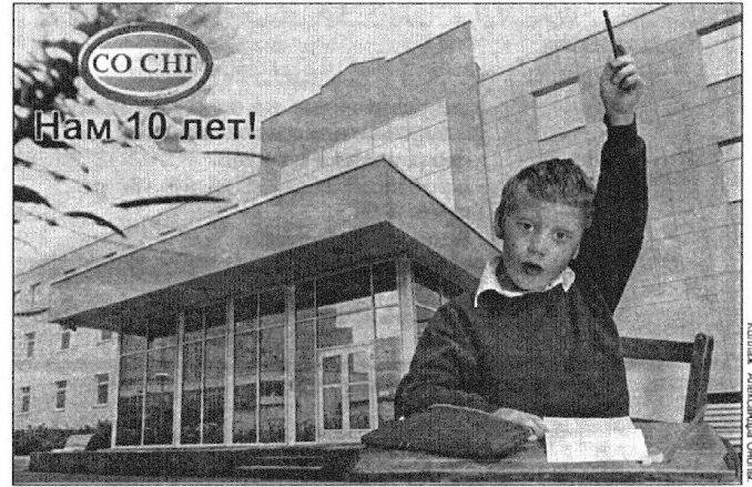
Коллаж Александра Очипка

видам страхования составили 2,2 млрд.рублей. Гарантией надежности Страхового общества также являются страховые резервы, размер которых на начало 2006 года составил 2,6 млрд.рублей, и собственный капитал - 2,0 млрд.рублей. Страховому обществу «Сургутнефтегаз» рейтинговым агентством «Эксперт РА» присвоен рейтинг надежности А+ (высокий уровень надежности со стабильными перспективами).