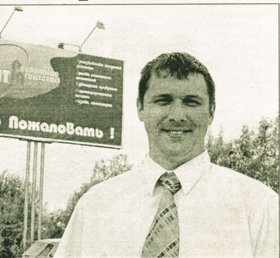
Коллаж Лилии Баранниковой

- Наш клиент - это тот, кто умеет считать деньги, - го-