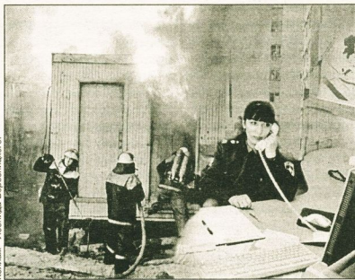
Коллаж: Людмила Березинского.

- Из 54 пунктов программы на сегодня выполнены 40. В частности, в п. Дорожном открыт пост пожарной охраны. Пожарным, численность которых до нормы - 439 единиц, выделялось жилье. Рабочие места оснащались компьютерами. Проведен капремонт зданий. Оборудован музей и издана книга об истории пожарной охраны. За последние два года большим шагом вперед можно назвать создание магистральных трубопроводов противопожарного водоснабжения, - говорит О. Белокопный.