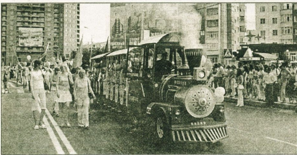
Праздничное шествие на улицах города было ярким и запоминающимся.