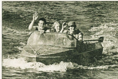
Многие сургутяне в этот праздничный день отправились на природу, к воде.