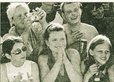
Равнодушных на празднике не было.