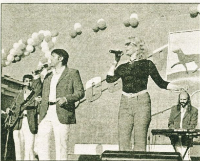
Горожан развлекали заезжие артисты. Благодарная публика принимала все номера на «ура».