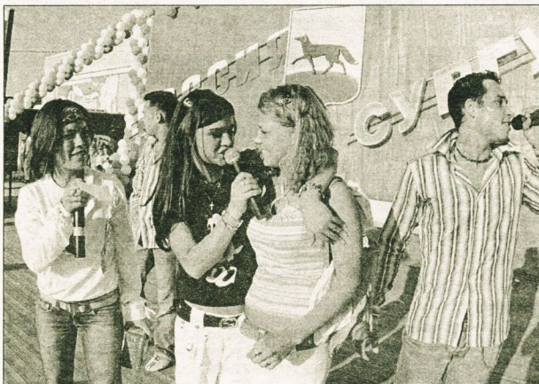
«Домовята» с удовольствием позировали с юными горожанами перед фотоаппаратами.