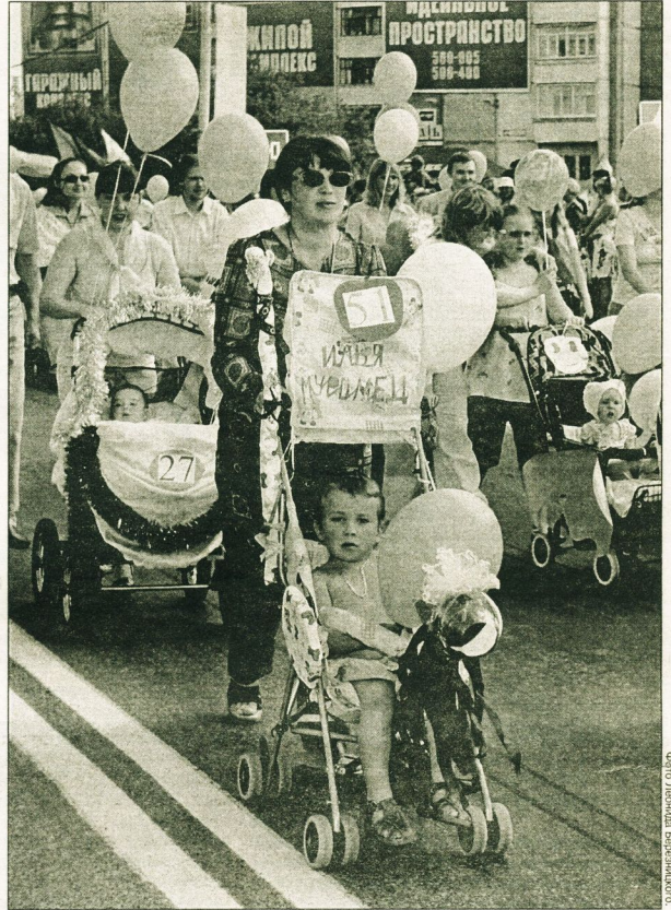
По улицам города гордо шествовало будущее Югры.