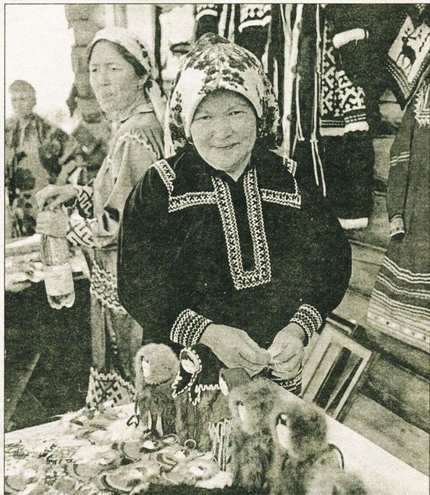
Сургут всегда отличался многонациональным колоритом.