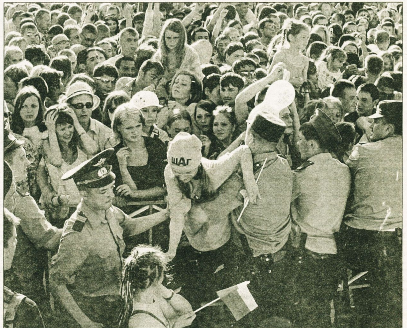
У милиции этот денек выдался жарким в прямом смысле слова. Стражи правопорядка сдерживали сургутян, рвавшихся к любимцам публики через заграждения.