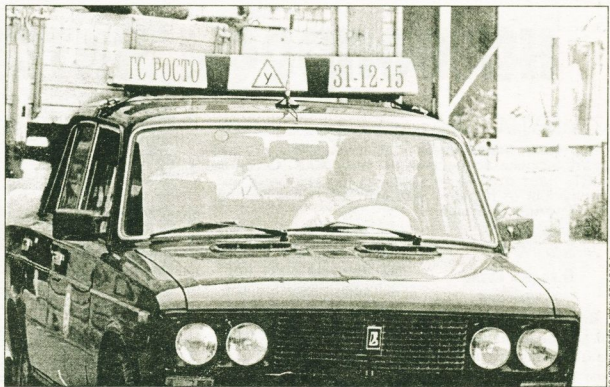
тоинспекторы рычаг воздействия на автошколу.

Если вы не сделали выбор на основе собственных впечатлений и рассказов учеников, то рейтингом автошкол, процентом сдачи и передаче экзаменов можно заинтересоваться в ГИБДД.