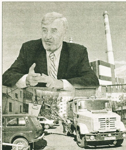
Коллектив Лепидия, Екатеринбург

Ответ. Согласно приложению 2 постановления администрации города № 351 от 07.12.2004 «О мерах по организации учета потребления коммунальных услуг и совершенствованию расчетов за газ, холодную и горячую воду, водоотведение, тепловую энергию на отопление в жилищном фонде», для определения объема тепловой энергии на отопление по теплосчетчику потребителю необходимо обратиться в управляющую компанию для составления трехстороннего акта готовности приборов учета к эксплуатации, дата в котором является на-