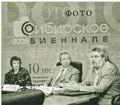
Коллектив Лыбачевского музея

Главными подарками к Дню города стали презентация культурно-коммуникационного центра «Сургут на рубеже тысячелетий» и открытие памятника архитектуры «Дом купца Клепилова». И то и другое - события неординарные. Первое - как привнесет в XIX века, а фотомультимедийная программа - как гость из будущего. Причем такого проекта, как «Сургут на рубеже тысячелетий», выполненного в стиле «хай-