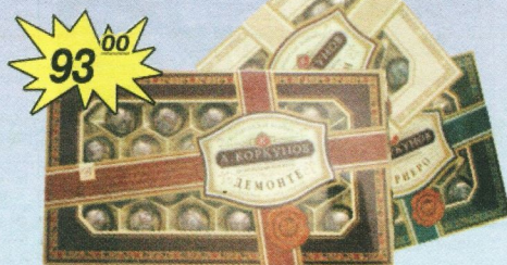
Конфеты «Окошко», Коркунов, 200 г.