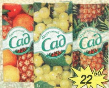
Сок «Фруктовый сад», 1 л в ассортименте