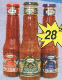
Кетчуп «Балтимор», 530 г