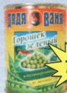
Горошек зеленый «Дядя Ваня», 360 г.