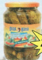
Огурчики «Дядя Ваня» «По-берлински», 680 г.