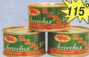
Икра красная лососевая зернистая, 140 г.