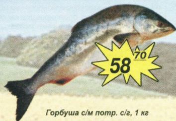
Горбуша с/м попр. с/з, 1 кг