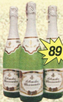
Шампанское «Советское», п/сл