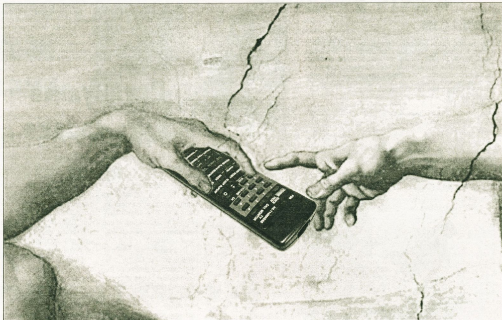
Коллаж Александра Олота

«Домашний» не прошел «обкатку» на демонстрационном канале, потому что последний незадолго до этого представил на суд аудитории телеканал «Стиль» - российский аналог «Fashion-TV». Таким образом, абоненты кабельного телевидения