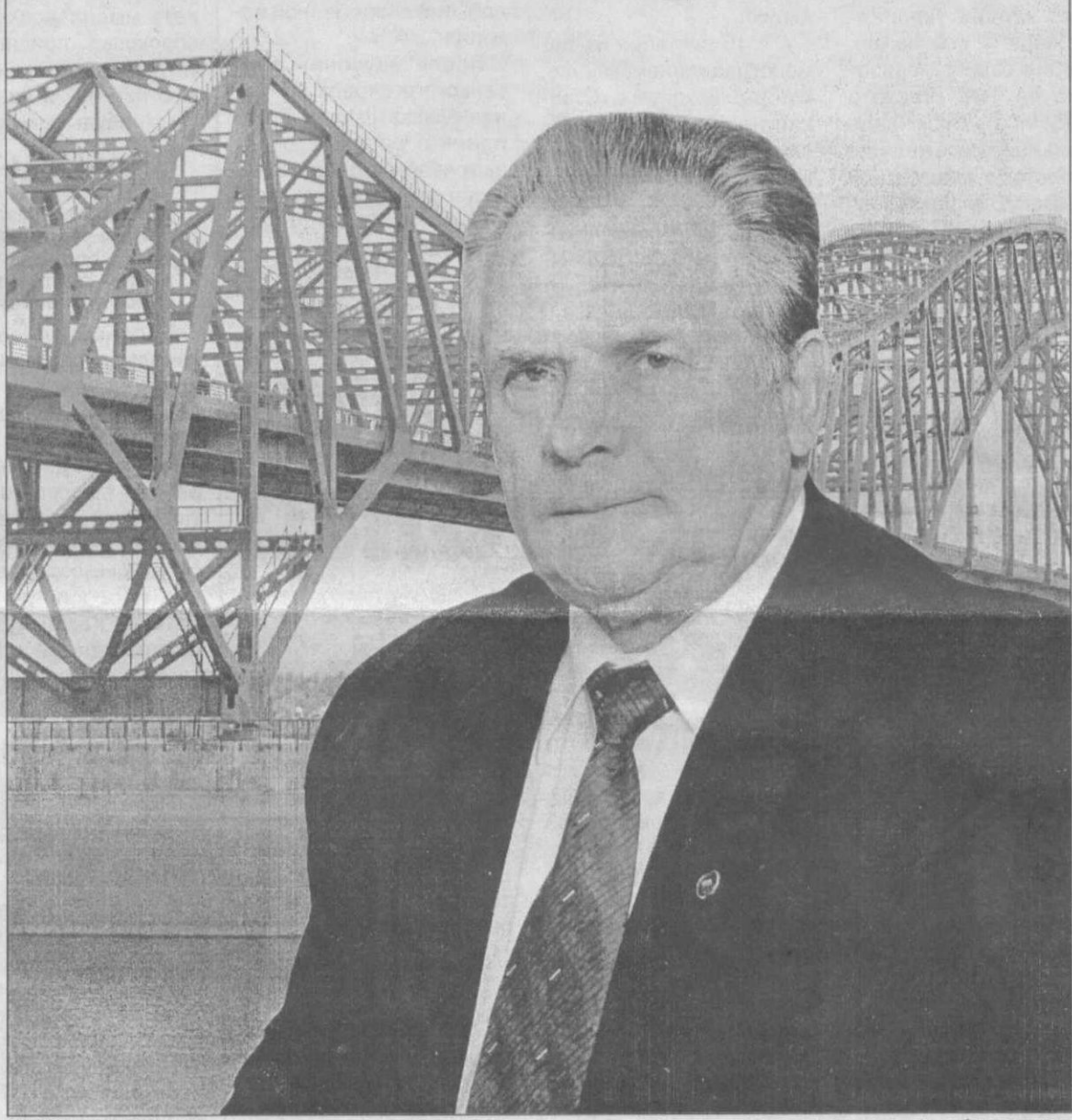
Коллектив Леннида Брежневского.