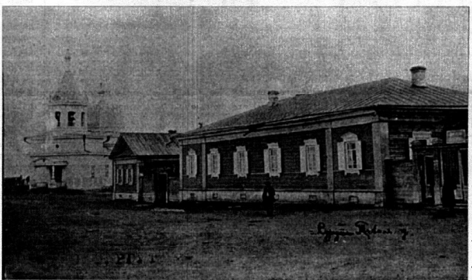
ВЫРЕЖИ И СОХРАНИ!

по наследству, и музейщики, разузнав об этом, уговорили владельца передать на выставку одну икону. Она выполнена на оштукатуренном дереве, поэтому требует спецрежима хранения. Музей продлит ее жизнь. Эту икону СКМ подарили. На выставке о православии были представлены и старые хоругви, которые предоставил Свято-Никольский храм - также по просьбе музейщиков, прослышавших о них. Когда-то по случайной случайности, в годы гонений на церковь, хоругви были спасены от уничтожения неизвестными людьми. Утверждать, что они из погибшего храма, конечно, специалисты не берутся. Однако очевидно, что это хоругви сургутских храмов или близлежащих, по крайней мере.