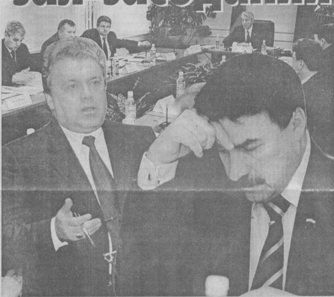
Коллаж Леониды Березниченко.