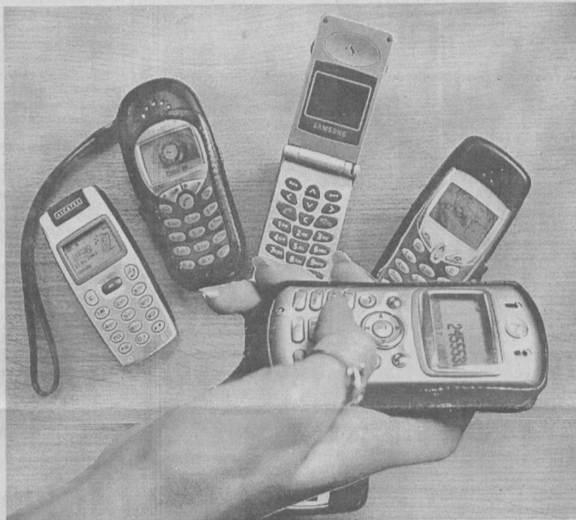
Коллаж Леонида Березинского