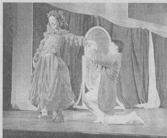
Д.Ленский, В.Сологуб «Вечер русских водевилей». Режиссер - Е. Долгина. Мастерская профессора РАТИ Б.Г.Голубовского. Дипломный спектакль.