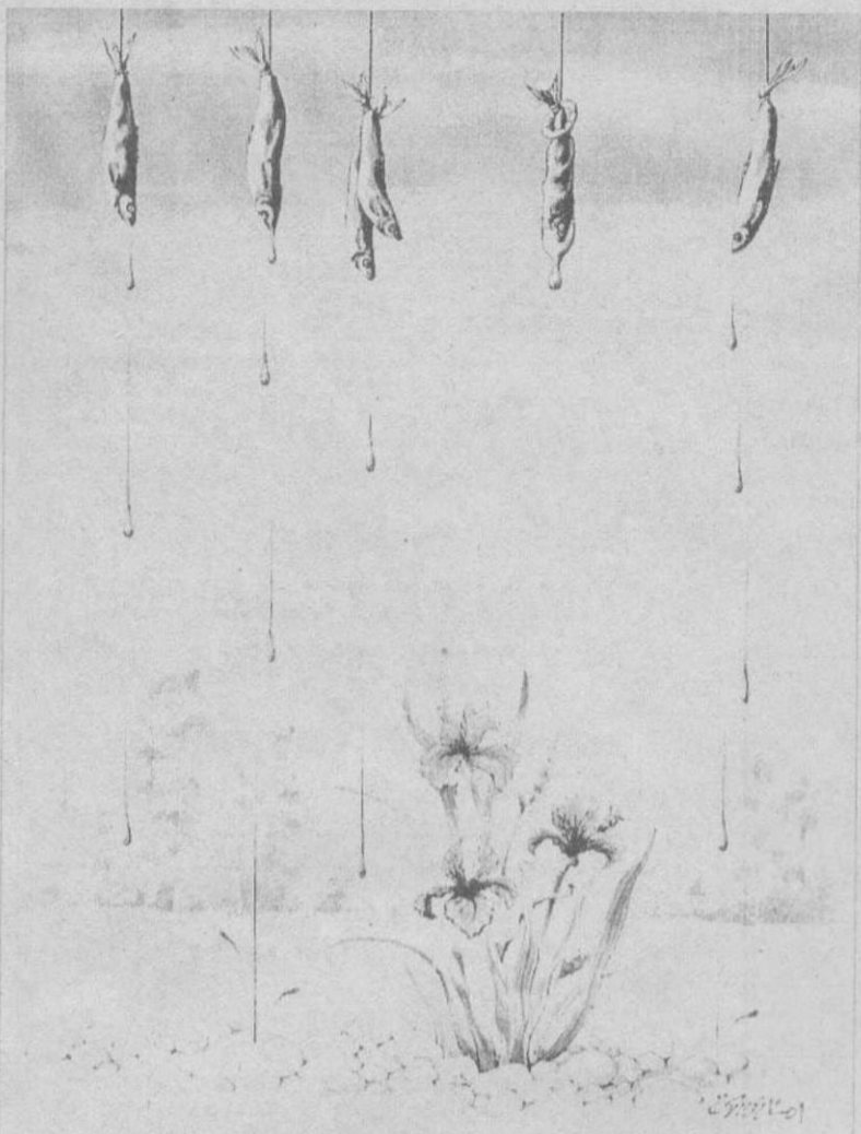
Из собрания Сургутского художественного музея. Рисунок Ерая Озбека (Турция).

Выставку карикатур и шаржей «Лицедейство» вы увидите в июне 2004 года.