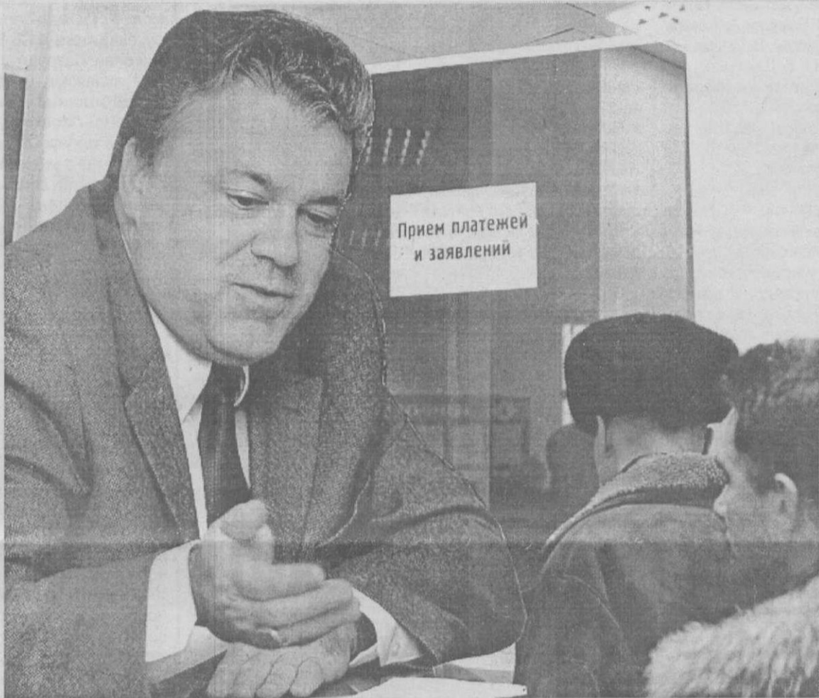
Коллаж Леонида Березинского.