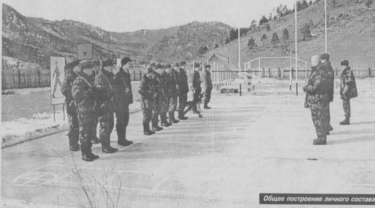
Общее построение личного состава.

Если есть общественная организация, ее представители, курирующие вопросы военно-патриотического воспитания призывников (особенно в погранвойска!), то для нас, для армии это только во благо. Зная полную характеристику призывника, зная, что за него ручаются, мы были бы спокойны в отношении его военной службы. Плохо, что