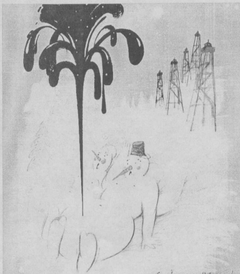
Из собрания Сургутского художественного музея. Рисунок Александра Лобачева (Россия).

Выставку карикатур и шаржей «Лицедейство» вы увидите в июне 2004 года.