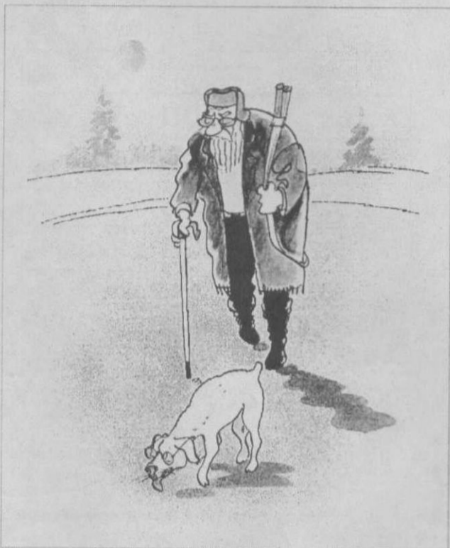
Из собрания Сургутского художественного музея. Рисунок Барханеттина Ардагила (Иран). Выставку карикатур и шаржей «Лицедейство» вы увидите в июне 2004 года.