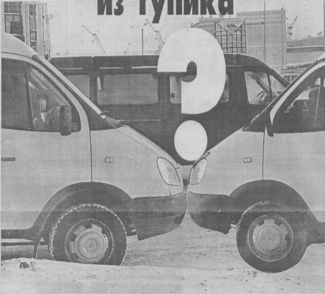
Коллаж Леонида Березниченко.