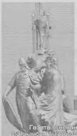
Газета основана 28 октября 1984 года