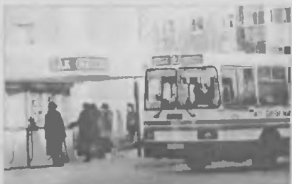
«Импровизация» для читателей «СТ»