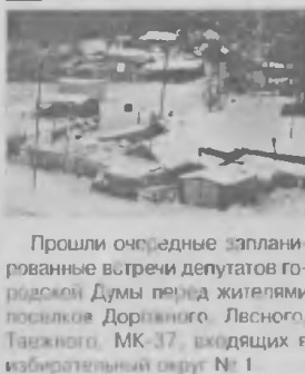
Прошли очередные запланированные встречи депутатов городской Думы перед жителями поселков Доржиного, Лесного, Таежного, МК-37, входящих в избирательный округ №1