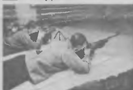
Заканчиваются двухдневные городские соревнования по пулевой стрельбе среди образовательных учреждений города на приз Российской армии. Во второй половине дня назовут победителей и призеров