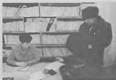
Забавная арифметика: каков же стаж?