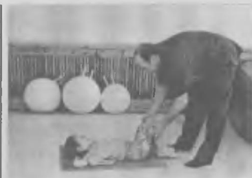
Состоялась ли «гармония души и тела?»