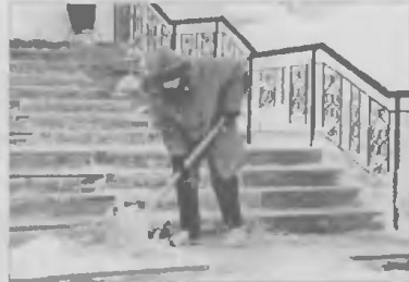
И добрые слова от людей слышат коммунальщики