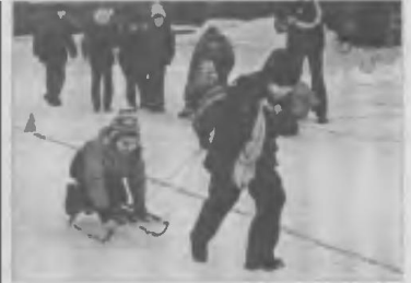
Корреспонденту захотелось прокатиться в детство...