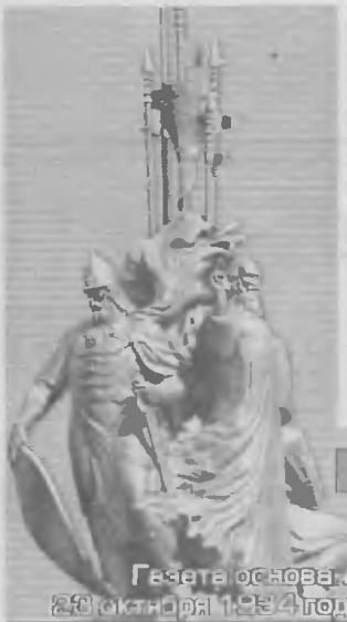
Газета основана в 28 октября 1994 года