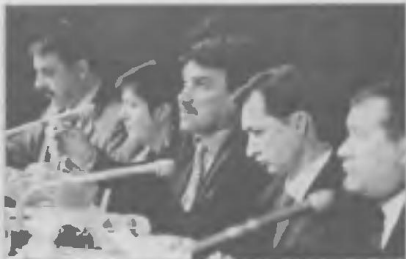
Не оправдывают, оказалось, избранные надежд...