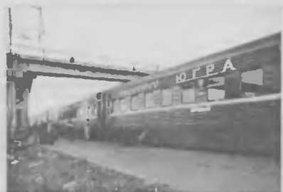
«Югре» нужна пара