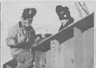
Махину в четыре тысячи тонн — по реке...