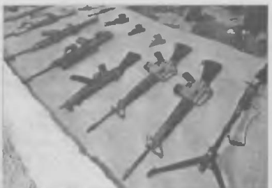
Телохранителей нет, есть портфельхранители. С ружьем