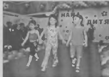
Две стороны медали: «Мама и дитя-2003»