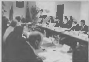
Мэр побывал у «своих», в «Сургутстройтресте»