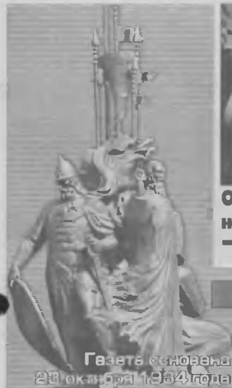
О чем спорили на городской Думе?