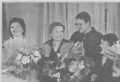
Газеты в аутсайдерах?