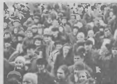
И это все о нас...