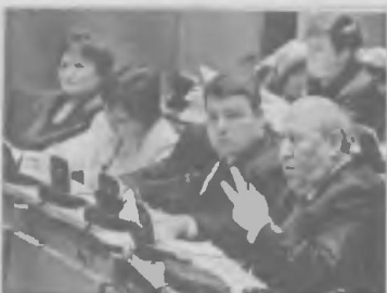
Дума: за кадром