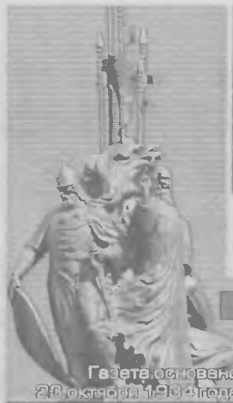
Газета основана 29 октября 1994 года