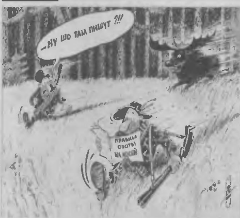
Из фондов Сургутского художественного музея. Рисунок Александра Пашко (Чехов).

Выставку карикатур и шаржей «Лицедейство» вы увидите в июне 2004 года.