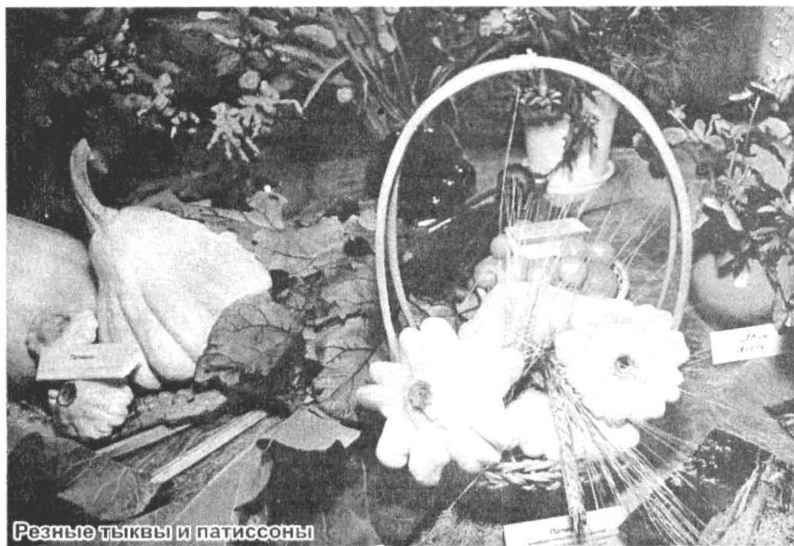
Резные тыквы и патиссоны

реснее, то есть удивить всех любопытных понастоящему. Ведь если удастся вырастить, то надо суметь свой товар и лицом преподнести. Потому не могу не отметить, что нынче, как никогда, садоводы порадовали всех творческим подходом к выставке. Было представлено много экспозиций, которые говорили сами за себя.