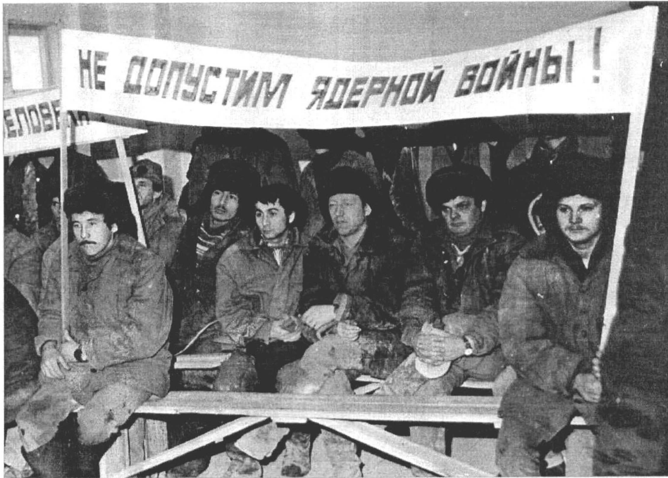
Сегодня мы открываем рубрику «История в одной фотографии». В ней редакция газеты планирует размещать снимки из обширного архива нашего фотокорреспондента Леонида Березницкого.

Сделанные в разные годы последней четверти двадцатого века и в