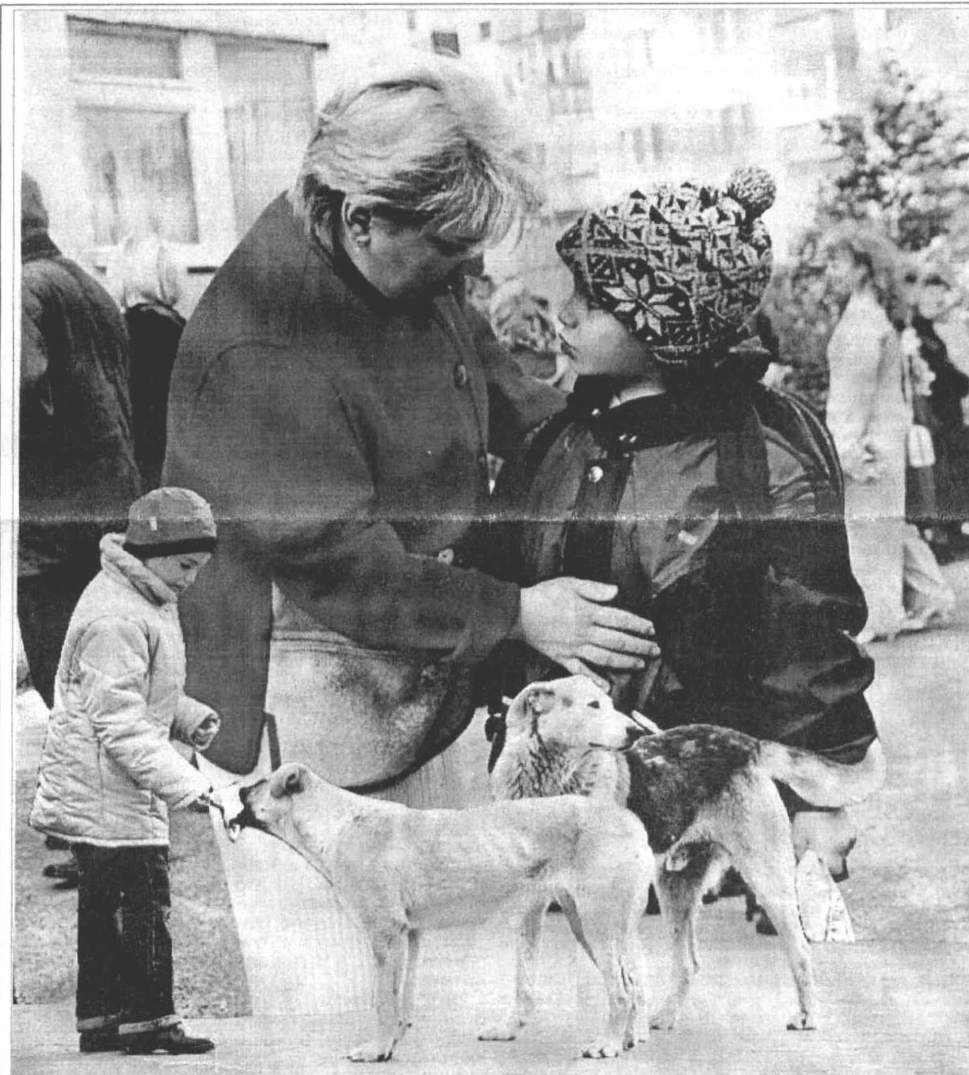
Коллаж Леонида Березницкого

По сообщениям российских и региональных СМИ.