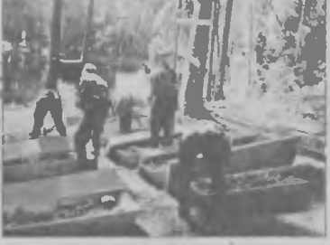
подготовка, все это вошло в учебную программу сбора.

ЛУЖСКИЙ РУБЕЖ. На этой земле в 1941-1944 годах влились горячие бои. Здесь, на берегу озера Глухого, которое еще называют Солдатским, и расположился лагерь. Конечно, многим девочкам и мальчишкам впервые довелось ухаживать за полковой кухней и так далее. Это понятно - дети городские. Два дня ушло только на то, чтобы сделать пригодным для жилья этот уголок природы. Однако за три недели им предстояло многому научиться. Пока - в форме игры, сорнования. Но не исключено, что в будущем полученные именно там, в далеком лесу, знания и умения пригодятся этим ребятам во взрослой жизни, в работе.