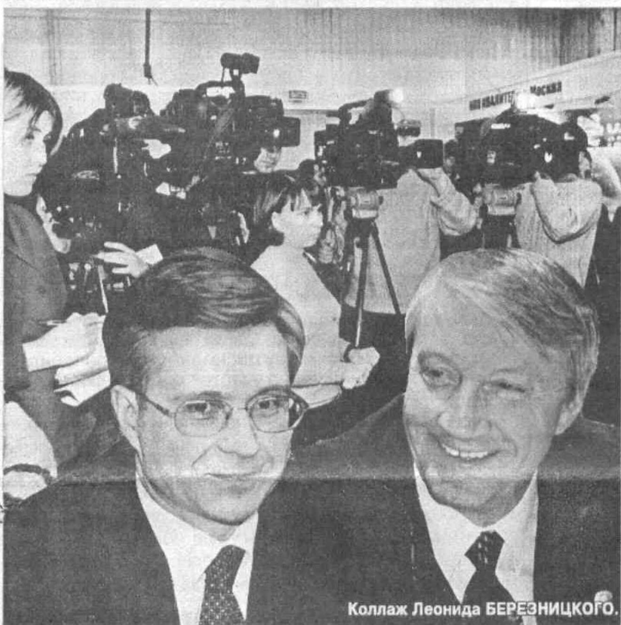
Коллаж Леонида БЕРЕЗНИЦКОГО.