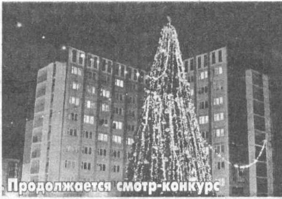
Продолжается смотр-конкурс на лучшее новогоднее оформление территорий СТР. 7