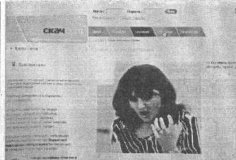
Skachcom - все обо всем. Для любознательных СТР. 4