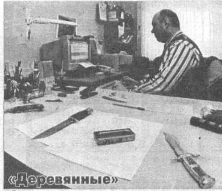
«Деревянные» фальшивомонетчикам не по «натуре» СТР. 5