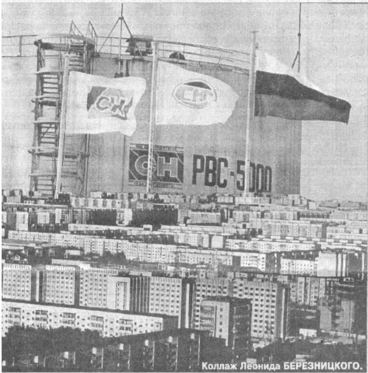
Коллаж Леонида БЕРЕЗНИЦКОГО.