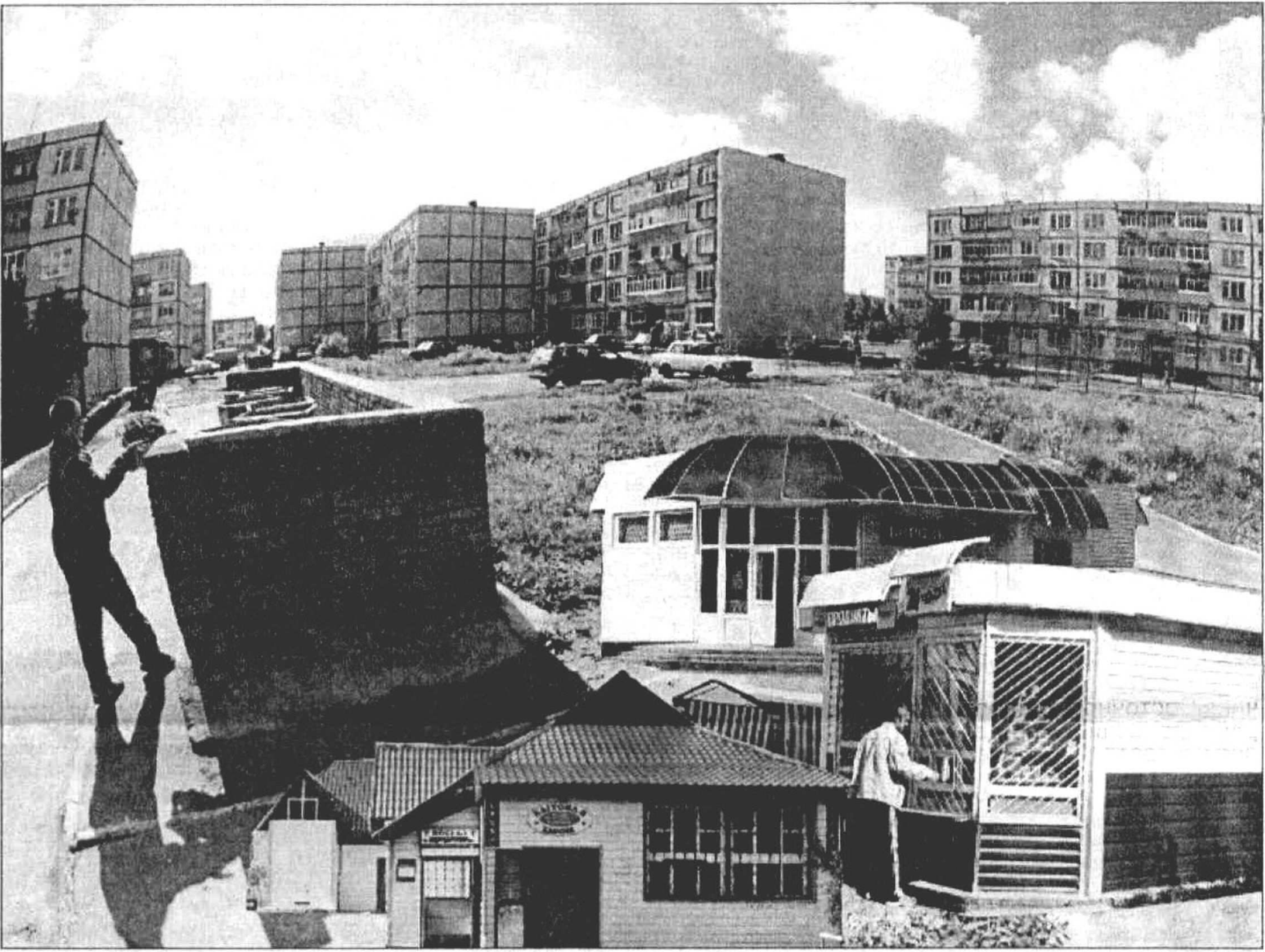
Коллаж Леонид БЕРЕЗНИЦКОГО.

К письму приложено заявление, под которым на нескольких листах 121 подпись. Признаться, много писем за журналистскую практику пришлось получить, но с таким количеством подписей - впервые. Причем номера домов, квартир,