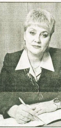
О. КОЛОДКИНА/БЕЗРЕГИОНАЛЬНЫЙ СЛУХ

- Сейчас при полпреде создается комиссия, которая будет заниматься снятием чиновничьих барьеров. Вопрос будет решаться очень жестко, вплоть до снятия чиновника с должности. О чиновничьем произволе достаточно будет написать письмо, и оно в короткие сроки будет рассмотрено. На мой взгляд, Сургут - один из тех городов Уральского округа, где чиновничий беспредел достиг своего апогея. Дело уже не столько в барьерах, сколько в самом предпринимательстве. Предположим, местная администрация не имеет права распределять муниципальные заказы среди муниципальных предприятий, они должны распределяться между предпринимателями. В Сургуте таких случаев предостаточно, в частности в ЖКХ.