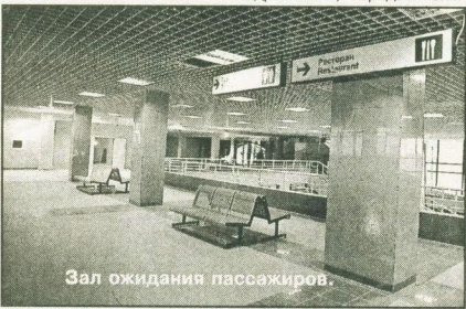
Зал ожидания пассажиров.

замысловатый каркас здания в виде волны, который придумал сургутский архитектор Блинов, уже стал поводом для народного названия аэропорта - «волнушка».