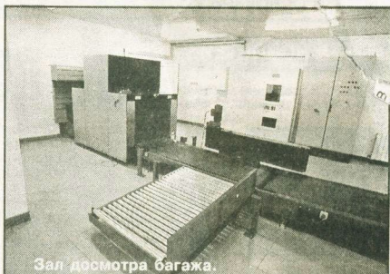
Зал досмотра багажа.

предприятий и вложенным в его строительство средствами, а это 10 млн. долларов США, в нашем городе появился новейший аэровокзал, отвечающий всем современным стандартам. И