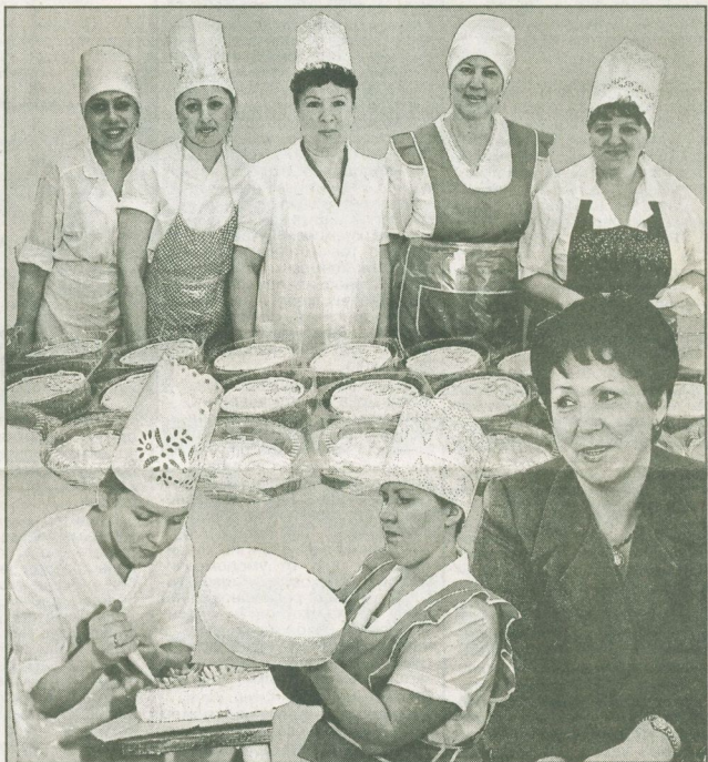
Коллаж: Людмила БЕЗРЕЗНИЦКОГО.

Дорогие сургутянки! Милые, любимые, единственные!