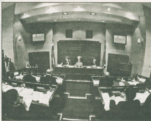
Олег Николаев, депутат Думы ХМАО

И если положения, требующие редакционной правки, на заседании Думы Ханты-Мансийского автономного округа второго марта проходили легко, то с голосованием по принципиальным моментам депутаты торопиться не стали. К первым можно отнести поправки в закон об охране окружающей природной среды и экологической защите населения, которые были приняты почти без обсуждения: в новом тексте закона утверждалось, что средства экологического фонда могут тратиться исключительно на ликвидацию последствий загрязнения окружающей среды.