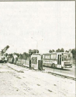
О ПОЛУЧЕНИИ МОНТАЖА МОНТАЖА