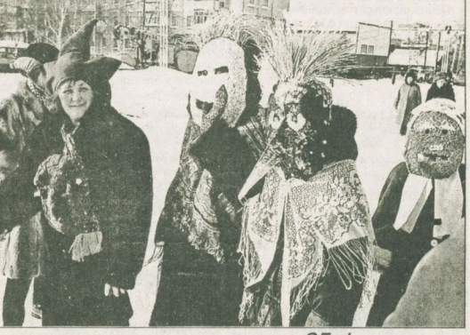
Так прошла масленица в микрорайоне энергетиков в воскресенье, 25 февраля.