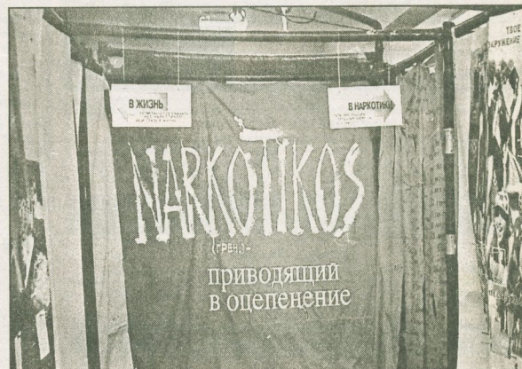
Газетная площадь предоставлена департаменту по социальным вопросам и здравоохранению. Страничку подготовила Екатерина БЕРШАНСКАЯ.

Если определились, то вот наш адрес: г. Сургут, ул. Мелик-Карамова, 57. Телефоны: 26-70-34, 26-68-76. Директор ГСОЦ «Геолог» - Василий Иванович Титаренко.