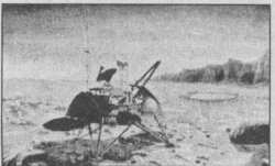
По сообщениям российских и мировых СМИ.

17 ЯНВАРЯ NASA прекращает попытки связаться с межпланетной станцией Mars Polar Lander. Третьего декабря 1999 года станция должна была совершить мягкую посадку на Марс недалеко от полюса, однако в установленный момент антенны дальней космической связи не смогли принять радиосигнал с Марса. Все прочие мероприятия по налаживанию связи со станцией тогда закончились неудачей. К настоящему моменту специалисты NASA не смогли определить точное место падения станции и обнаружить ее останки.