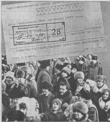
Коллаж Леонида БЕРЕЗНИЦКОГО.

В ноябре-декабре в ГНИ возник ажиотаж, так как прошла неверная информация, что, если вы не получите вовремя идентификационный номер, вам грозит штраф в размере пяти тысяч. Однако этот штраф на самом деле распространяется только на категорию индивидуальных предпринимателей