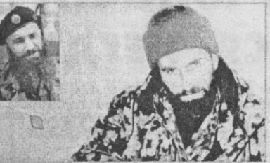
По сообщениям российских и мировых СМИ.

ЗА ГОЛОВУ чеченского полевого командира Шамиля Басаева объявлена цена в 1 млн. долларов, заявил генерал Г.Трошев.